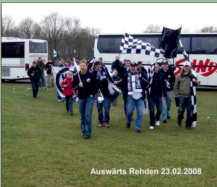
Auswärts Rehden 23.02.2008